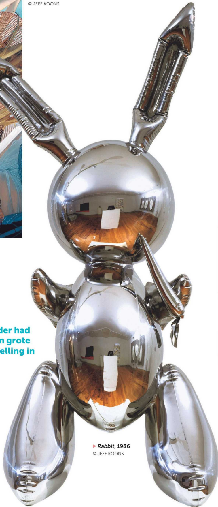
► Rabbit, 1986 © JEFF KOONS

Nooit eerder had Koons zo'n grote tentoonstelling in Europa