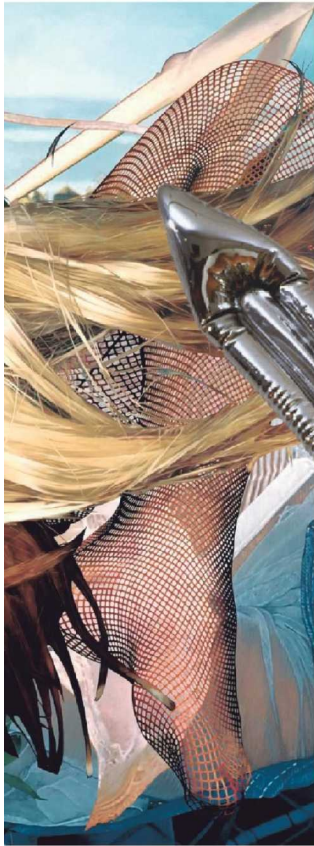
► Junkyard, 2002 © JEFF KOONS

Nooit eerder had Koons zo'n grote tentoonstelling in Europa