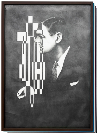
Der Zerfall der Eigenschaften/Collapse of Features (T.S. Eliot), 2014

Ein versteckter Hinterhof, verwinkelte Gänge, einige Treppen und zwei schwere Türen – dann hat man es geschafft. In MATTHIAS BITZERS Atelier reihen sich akkurate Porträts von großen Literaten an bunte Collagen und fragile Skulpturen