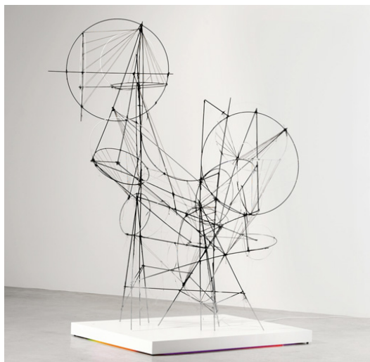
Blood Memory (Satellites colliding), 2012

BITZER: Meine Sammler kennen meine Kunst genau und geben mir viel Feedback. Diese Form von Reibung und Austausch ist schon wichtig. Aber vor allem braucht man eine gesunde Selbstkritik und muss ständig hinterfragen, wo man eigentlich steht. Ich glaube, das aufrechtzuerhalten ist mit das Allerschwerste.