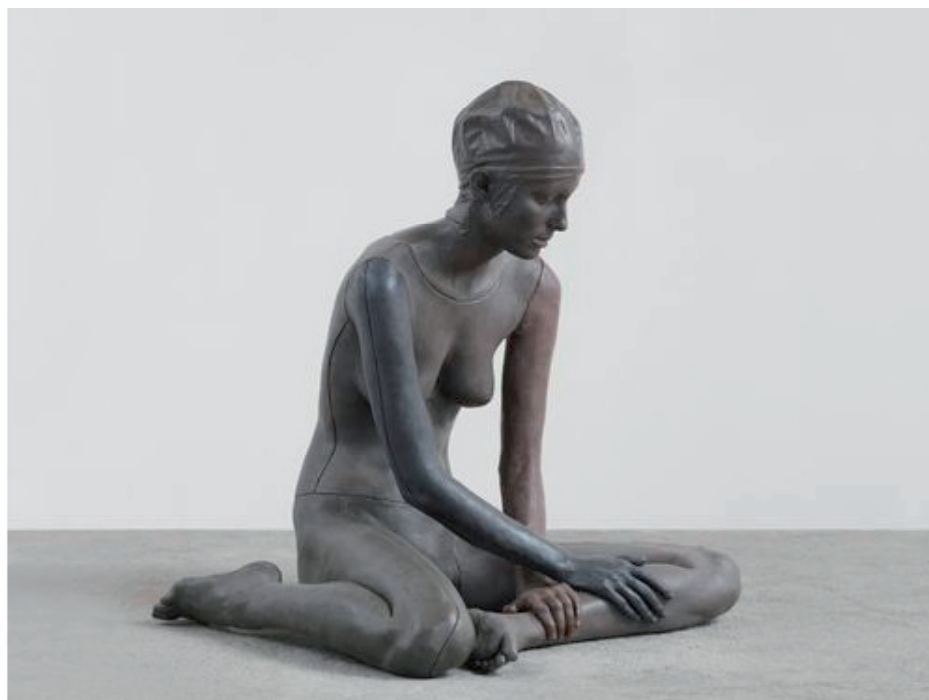
Ugo Rondinone, nude, 2011. Wax and earth pigments, 32 x 32 x 25 1/4 inches (81 x 81 x 64 cm), Copyright Ugo Rondinone. Courtesy Gladstone Gallery, New York and Brussels

Boeiender wordt de reeks als men die in relatie ziet tot de tweede zaal. Daar worden de vele aquarellen vertaald naar grote, glinsterende formaten met afgeronde vormen in acryl op glas, versterkt met plastic en plexiglas. De intieme pastels in de eerste zaal fungeren dan ook als voorbereidende schetsen - die de kunstenaar overigens niet verkoopt - voor het meer flashy werk.