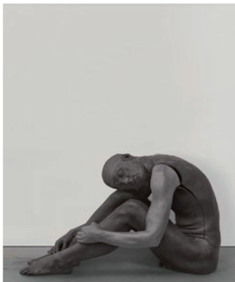
Ugo Rondinone, nude, 2011. Wax and earth pigments, 23 1/4 x 39 7/8 x 22 1/8 inches (59 x 101 x 56 cm).

Sam Steverlynck | Ugo Rondinone is een veelzijdig kunstenaar. Als je door een overzichtswerk van zijn oeuvre bladert, heb je soms de indruk dat je een catalogus van een groepstentoonstelling aan het doornemen bent. Momenteel is werk van Rondinone te zien twee internationale topgaleries die in Brussel een bijhuis hebben: Almine Rech Gallery (Parijs) en Gladstone Gallery (New York).