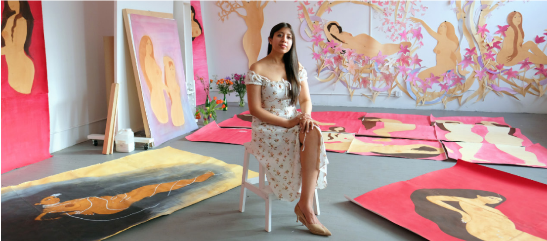
Tom WESSELMANN Monica with Tulips, 1989 Émail sur aluminium 144.8 x 182.9 cm 57 x 72 in © Courtesy of the Estate and Almine Rech © 2022 The Estate of Tom Wesselmann / Artists Rights Society (ARS), New York Photo: Jeffrey Sturges

Formée à la miniature indo-persane au Pakistan, si l'artiste s'est, au fil du temps, émancipée des cadres aussi bien académiques que moraux auxquels elle était soumise, son œuvre en porte encore les traces.