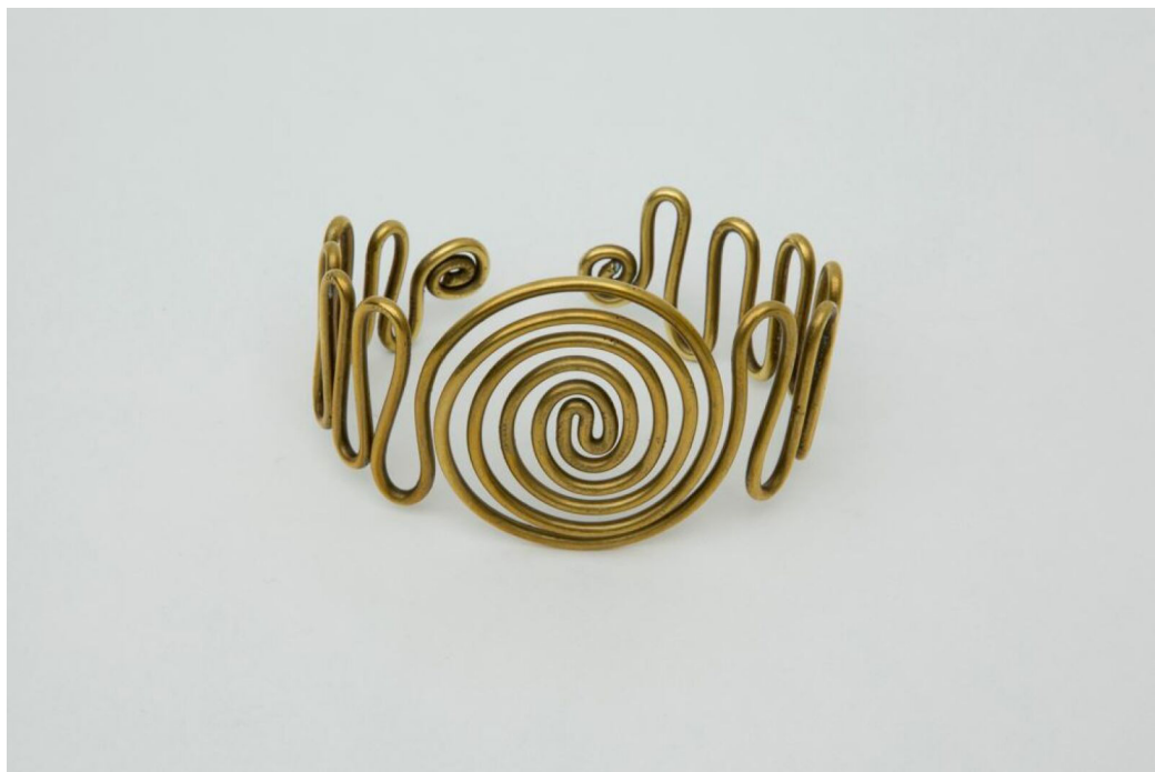
Alexander Calder, Bracelet, 1938.