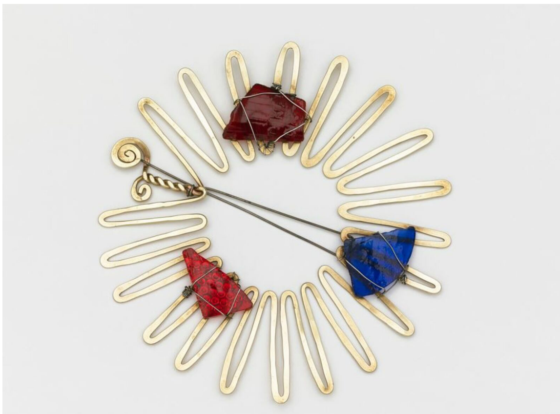
Alexander Calder, Brooch, 1938

Alexander Calder, le touche-à-tout bricoleur de l'art, fait son grand retour en galerie parisienne. Une exposition unique, sur ce proche de Marcel Duchamp et de Jean Arp qui révolutionnera l'art abstrait en lui apportant volume et couleur. Sa vision singulière de la sculpture bouleversera l'histoire de l'art. Ses mobiles, en perpétuel mouvement, s'animent au gré du vent et des courants d'air, livrant une vision nouvelle perpétuelle au spectateur qui l'observe. Dans cet art cinétique, la nature et l'art ne font qu'un, l'aérien est concilié au terrestre : cette fusion nouvelle, qui rompt avec les conventions, achèvera de faire passer Alexander Calder à la postérité.