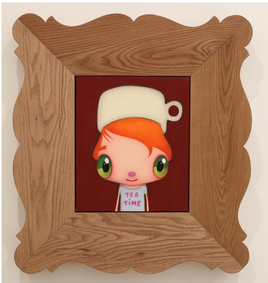
"Tea Time", 2022 de Javier CALLEJA

Du 2 au 25 juin, Almine Rech exposera « This Is Your Lucky Day », première exposition solo parisienne de l'artiste espagnol Javier Calleja (né à Màlaga en 1971).