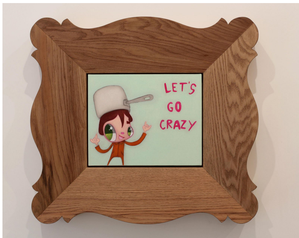
"Let's go crazy", 2022 de Javier CALLEJA - Courtesy de l'artiste et de la Galerie Almine RECH © Photo Éric Simon

Tout y est : croquis approximatifs de ses célèbres personnages, expérimentations de la forme des visages, des coiffures ou des yeux, associations colorielles ou essais de composition, en passant par des listes de mots et de citations, marques gestuelles et données réelles aléatoires - numéros de téléphone, dates, lieux, etc.