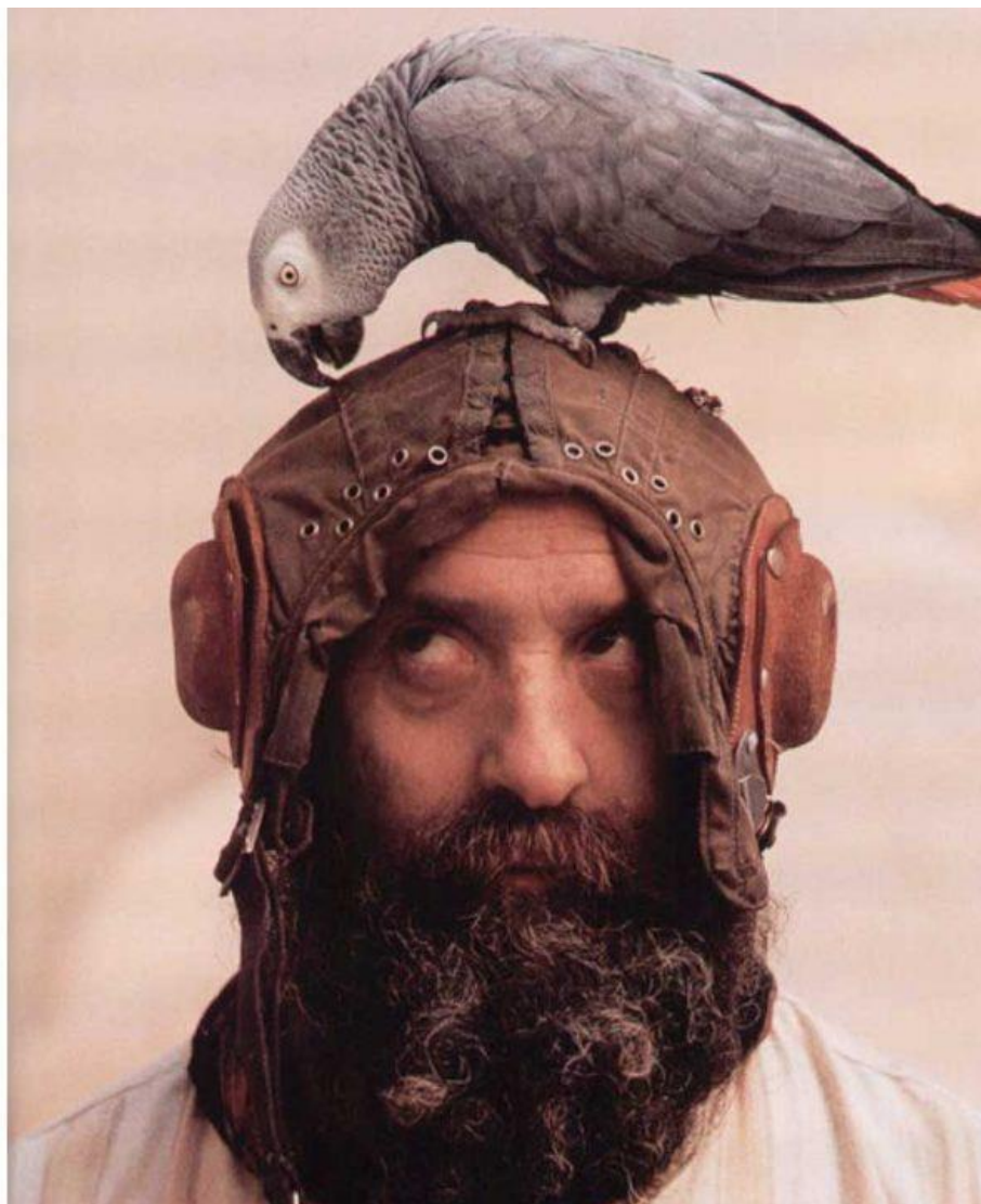
César en 1975.

César & César & César... Almine Rech Paris présente une exposition qui célèbre les périodes et styles majeurs de l'œuvre du grand sculpteur français. En l'honneur du centenaire de la naissance de César, l'exposition intitulée "César & César & César...", offrira un panorama du travail du célèbre artiste à travers ses explorations de différents matériaux.