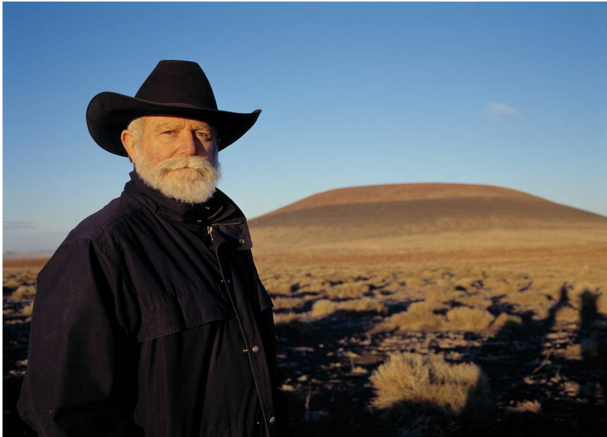
James Turrell devant son projet du Roden Crater, octobre 2001.