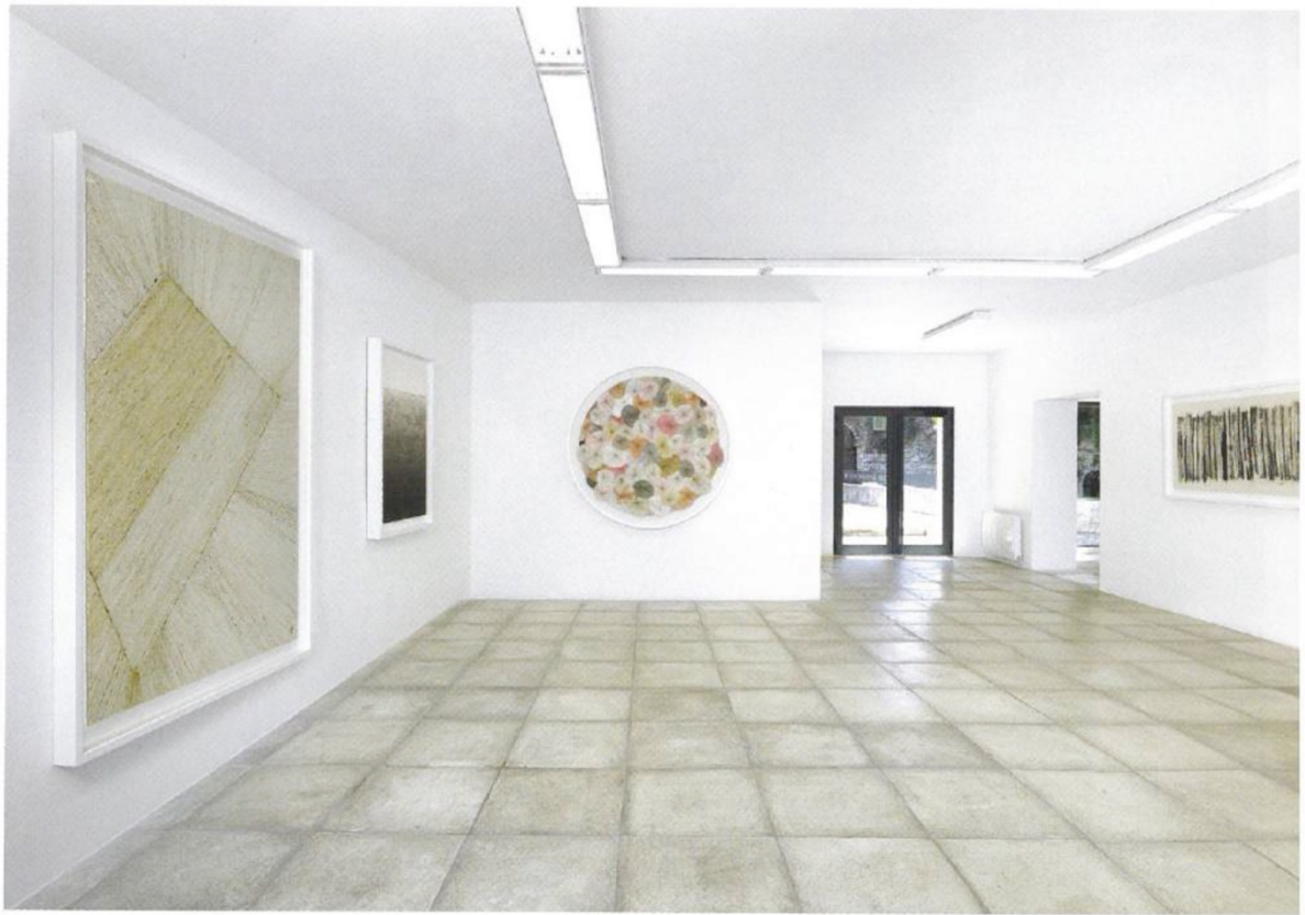
Vue de l'exposition de Minjung Kim, galerie Catherine Issert, Saint-Paul-de-Vence, 2019.

se manifeste par différents groupes d'œuvres qui se distinguent formellement mais dont les constituants principaux se relaient ou bien encore se répondent au sein d'une relation dialectique intrinsèque.