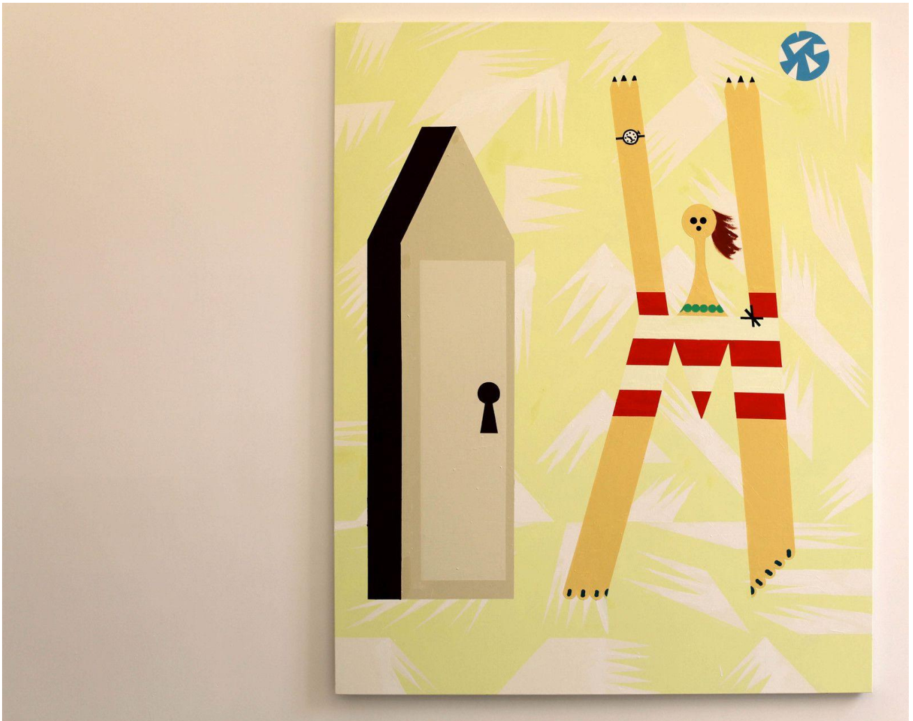
"The Beach 2", 2020 de Farah ATASSI

musique, objets du quotidien ou accessoires de cirque figurés dans des pièces dont les décors aux motifs colorés rappellent les toiles de Mondrian, l'esthétique du groupe de Memphis, le tartan écossais ou encore les tissus Pucci.