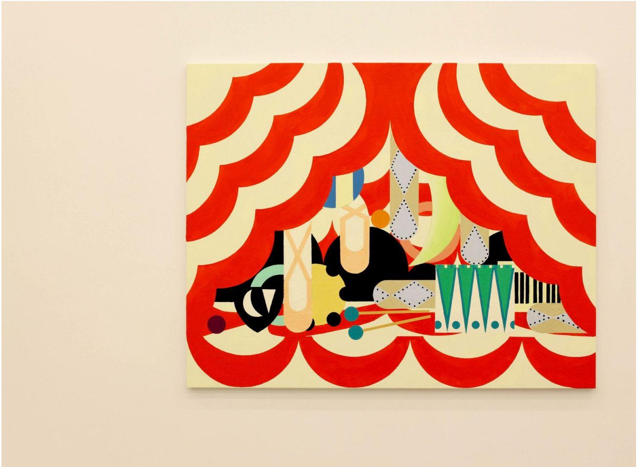
"The Ballet", 2020 de Farah ATASSI

Les répétitions formelles qui parsèment les toiles d' Atassi - comme les petits ronds noirs qui désignent alternativement des yeux, un ballon de plage à pois, des dés, les heures d'une horloge ou les chiffres d'un cadran téléphonique ne font pas que créer un lien visuel fort entre les sujets et leur environnement : elles ont aussi pour effet d'aplatir l'espace, de créer une confusion entre ce que nous pensons être les arrière-plans et les premiers plans de ses tableaux. Même si elle emploie la perspective à point de fuite pour créer des illusions convaincantes de dimension et de distance, Atassi ne cesse de réattirer l'œil vers la surface de ses toiles, qui révèle une topographie subtile formée de couches de peinture à l'huile pressées contre du ruban adhésif.