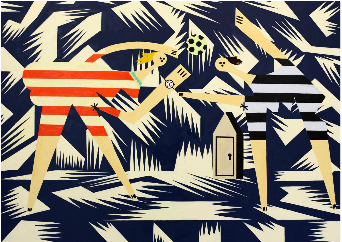
"The Beach", 2020 de Farah ATASSI