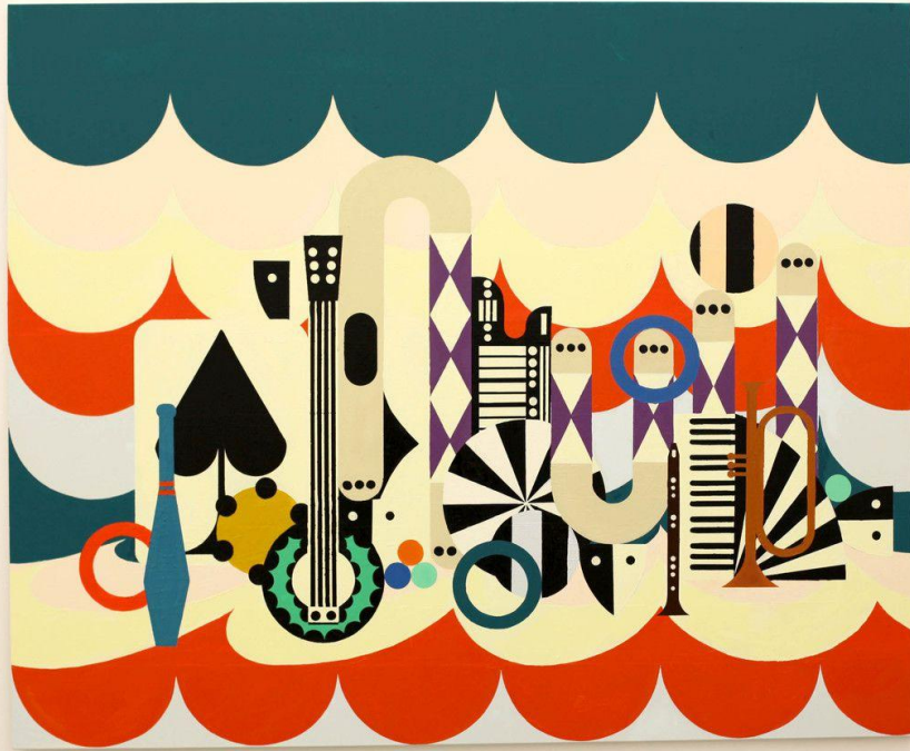
"Circus 2", 2020 de Farah ATASSI - Courtesy Galerie Almine Rech © Photo Éric Simon