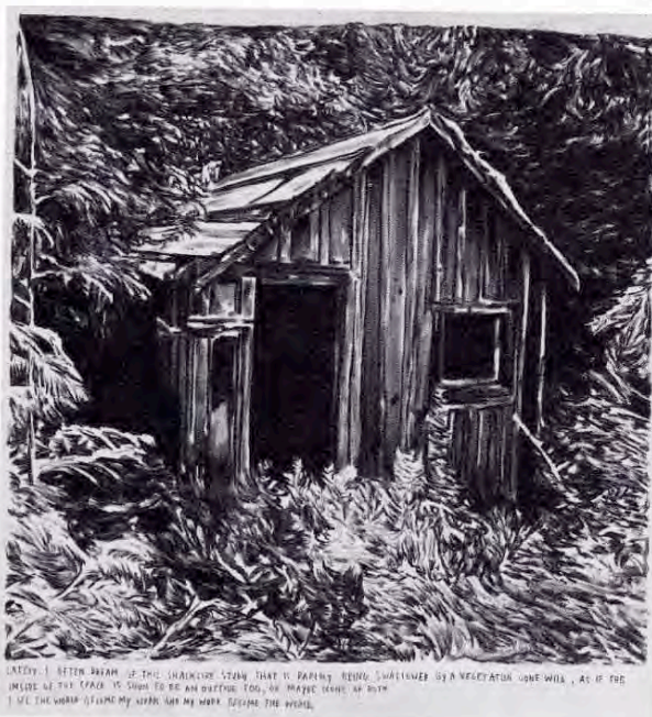
SAVED: I BETTER PRAY IF THE SHACKLING STAND THAT IS PAPING BEING SWALLOWED BY A REVELATION COME WILL, AS IF THE INSIDE LET THE PAPER TO STAND TO BE AN OFFERED TOGO, OR MAKING BEING AP WITH I SEE THE WORLD GETTING MY WORK, AND MY WORK, BEING THE WORLD.