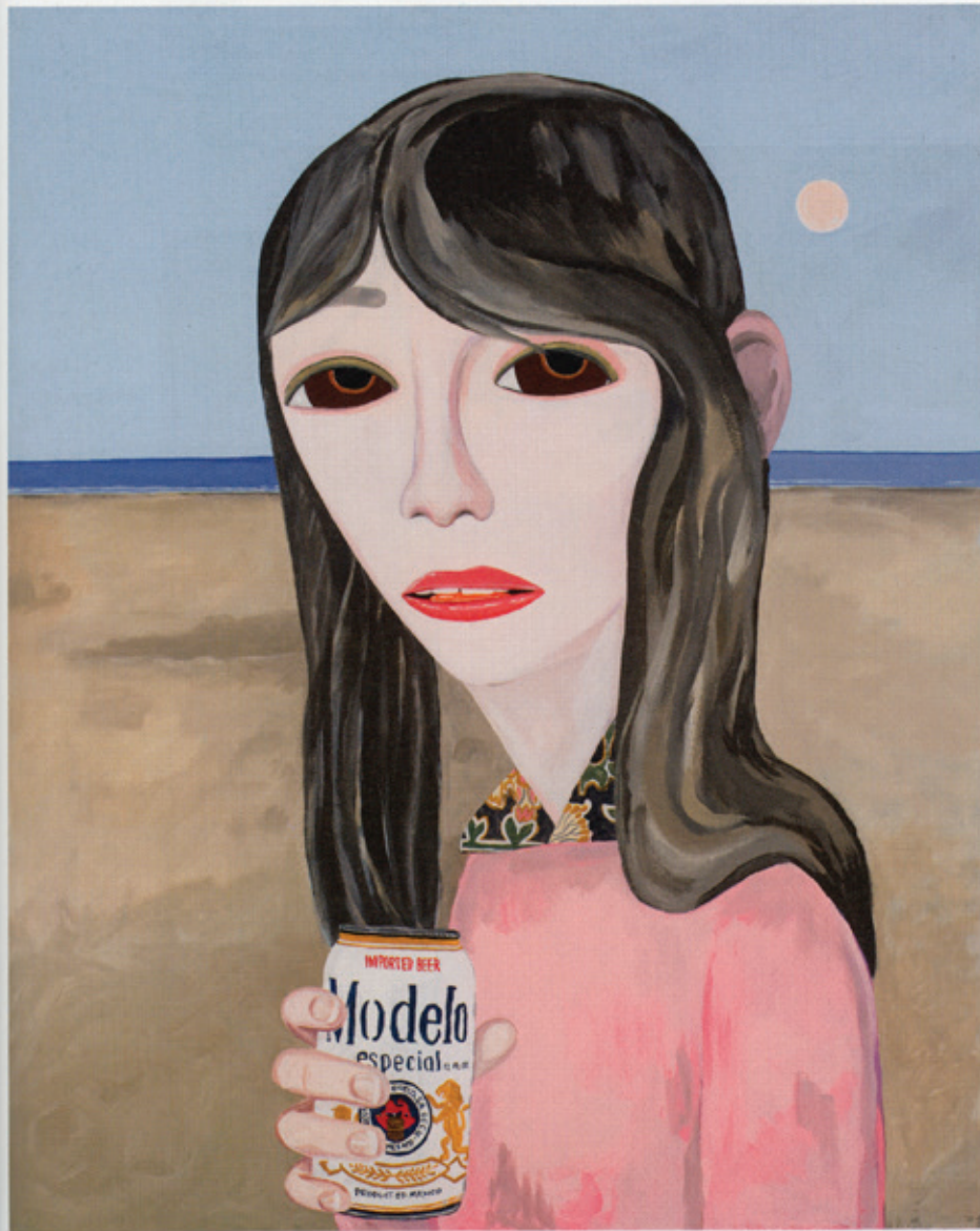
Alta California, 2009 Acrylic on canvas/Acryl auf Leinwand 152 x 122 cm Courtesy Anton Kern Gallery, New York; Corvi-Mora, London © the artist