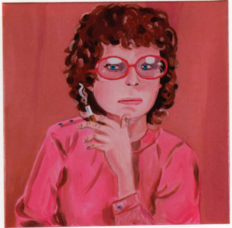
LAX , 2010 Oil on canvas / Öl auf Leinwand 30 x 30 cm