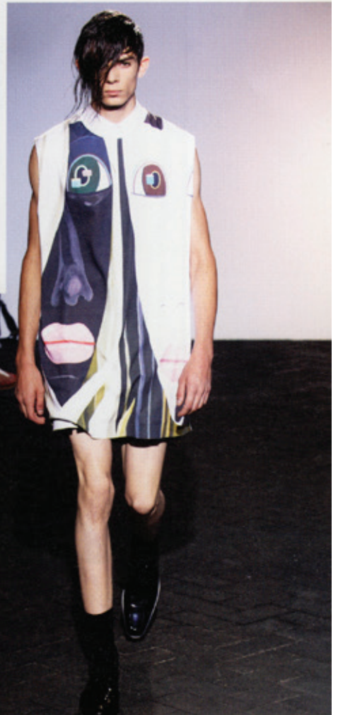
Raf Simons' Spring/Summer 2013 menswear collection/Herrenkollektion Frühjahr/Sommer 2013