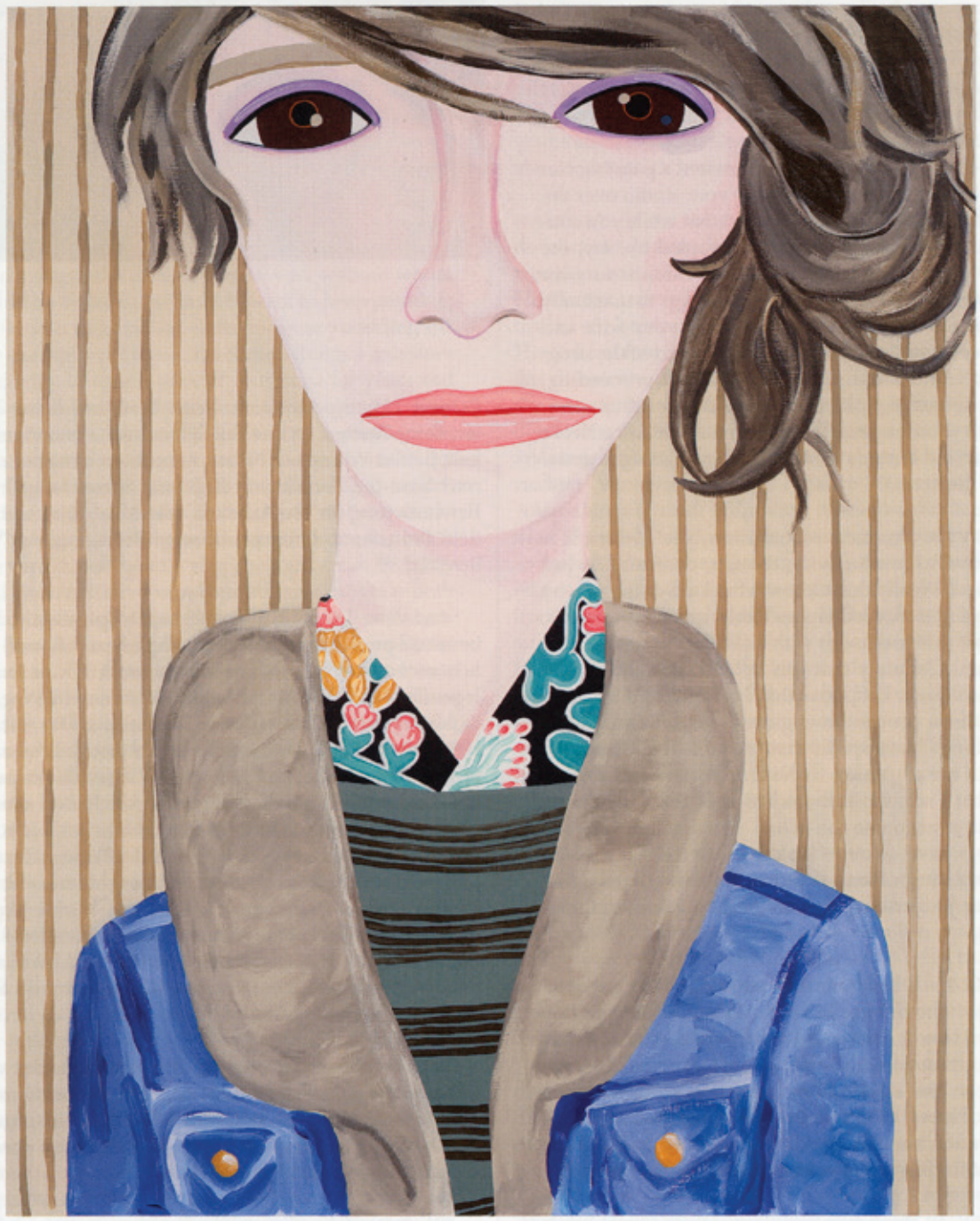
Pinch , 2009 Acrylic on canvas / Acryl auf Leinwand 152 x 122 cm Courtesy Anton Kern Gallery, New York; Corvi-Mora, London © the artist