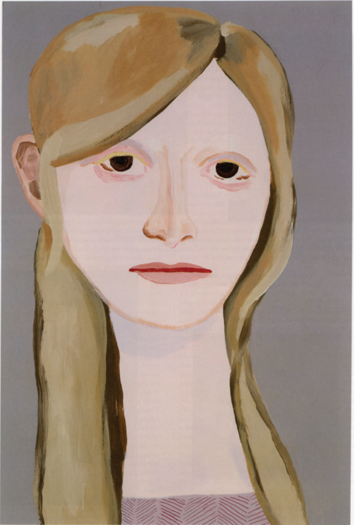
Rose Gold , 2007 Acrylic on board / Acryl auf Karton 91 x 61 cm