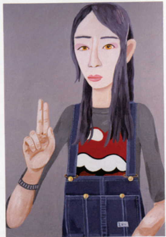
Music (Borrowed Tune) , 2006 Acrylic on canvas / Acryl auf Leinwand 91 x 61 cm Courtesy Anton Kern Gallery, New York; Corvi-Mora, London © the artist