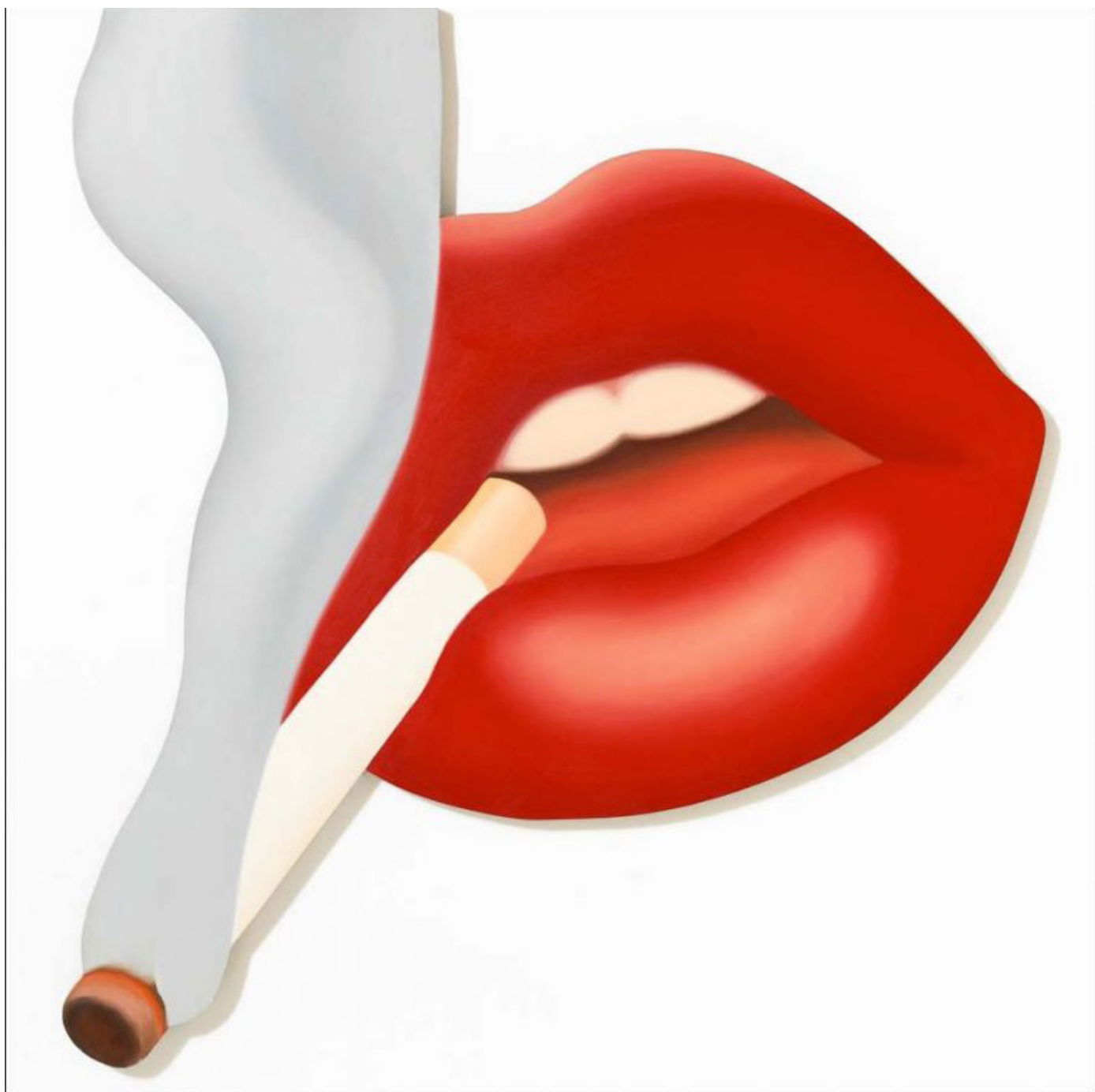
Tom Wesselmann, Smoker #3 (Mouth #17), 1968, Huile sur toile, 182 x 170 cm Courtesy succession Tom Wesselmann et Almine Rech gallery

L'exposition « A Different Kind Of Woman » de Tom Wesselmann à la galerie Almine Rech offre une importante rétrospective de ce représentant majeur du pop art américain. Une œuvre-performance ainsi que des tableaux historiques sont présentés.