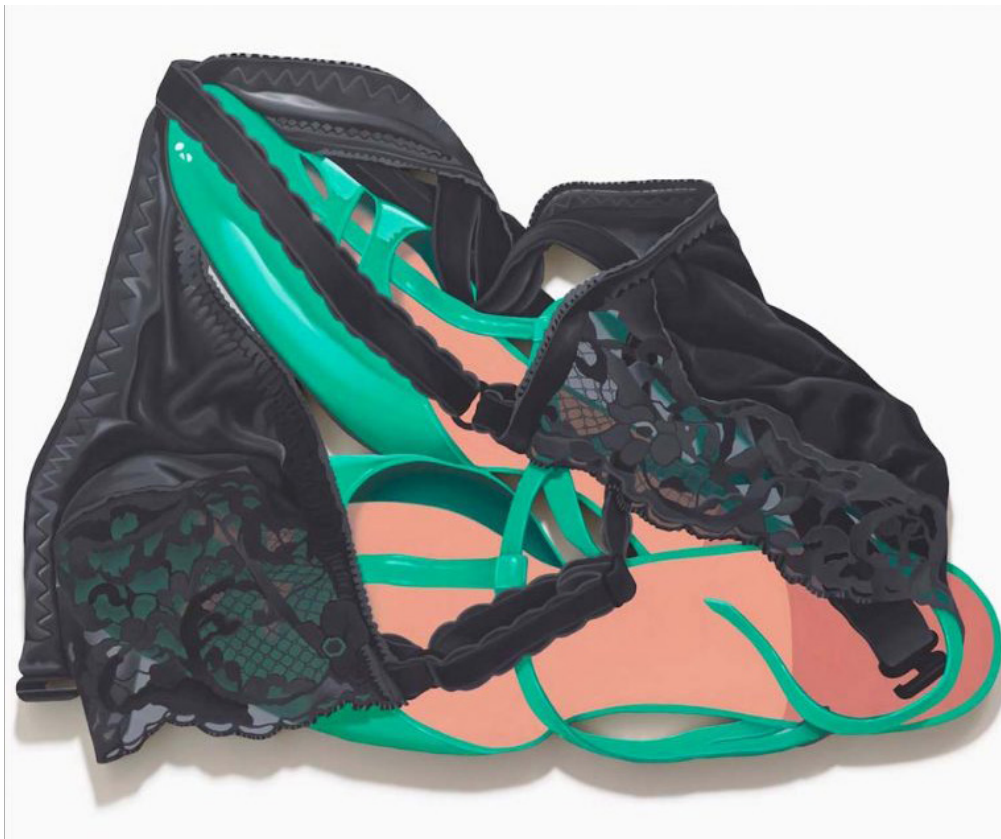
Tom Wesselmann, Black Bra and Green Shoes, 1981, Huile sur toile, 173 x 240 cm