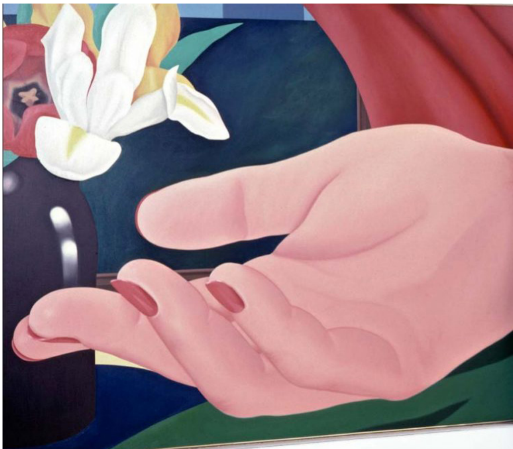
Vue de l'exposition (détail), Sidney Janis Gallery, New York, 1983

D'autres œuvres historiques de Tom Wesselmann sont réunies. Des peintures des années 1960 témoignent du rôle majeur joué par l'artiste au sein du mouvement pop art américain. Le traitement classique du nu, du paysage et de la nature morte s'opposent aux principes de l'expressionnisme abstrait. Le tableau intitulé Smoker #3 (Mouth #17) montre en gros plan une bouche aux lèvres rouges et charnues tenant une cigarette allumée. Un motif typique de Tom Wesselmann, où s'affirment des courbes sensuelles et des couleurs éclatantes. Des assemblages associent objets usuels et prospectus publicitaires pour créer de saisissantes visions.